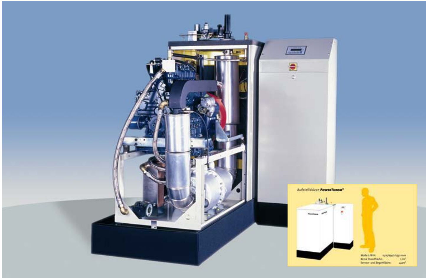
Geöffnetes PowerTherm® / 20kW elektrisch / 43kW thermisch